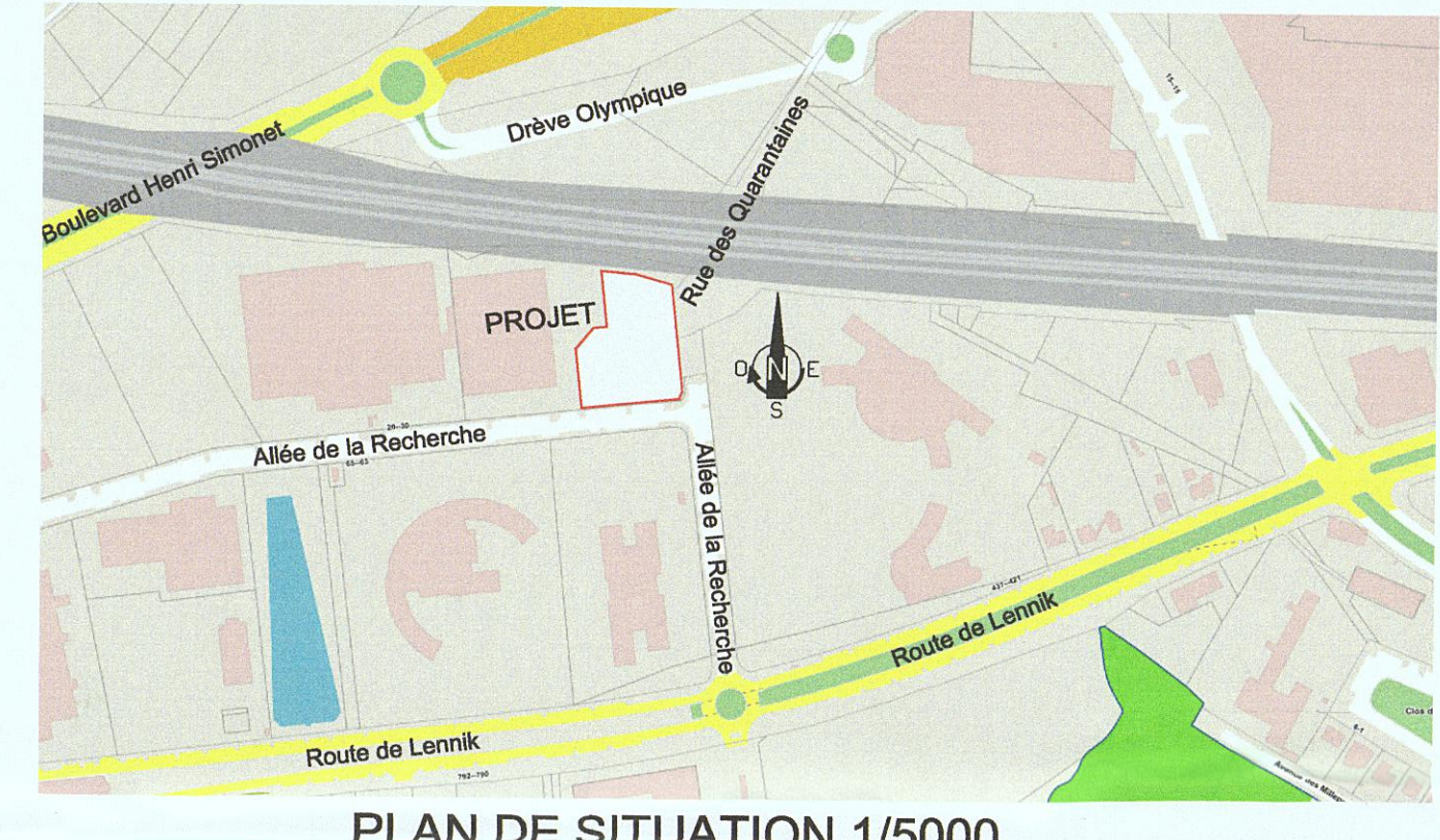
PLAN DE SITUATION 1/5000